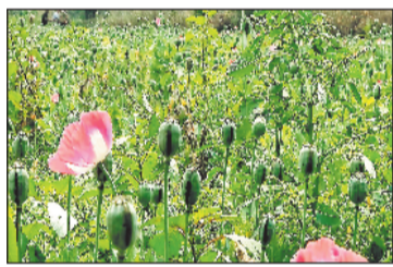
एक अलग ही नेटवर्क से जोड़ दिया है। यह गांव आदिवासी बाहुल्य है और ऐसे किसी नशीले पदार्थ के बारे में जानकारी तो क्या सुने तक नहीं थे। अफीम की खेती करने वाले दोनों

तमनार के आमाघाट में अफीम की खेती का जो मामला सामने आया है वह गांव को