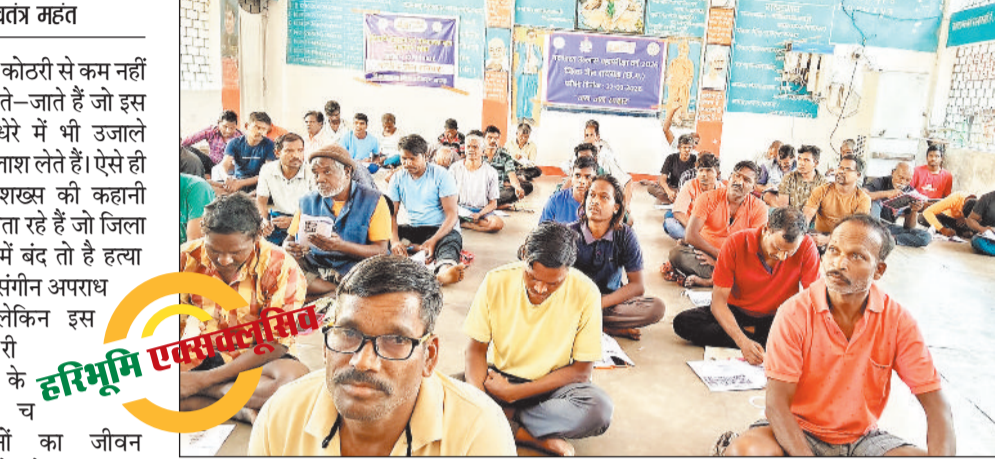
जेल में उल्लास परीक्षा देते बंदी।